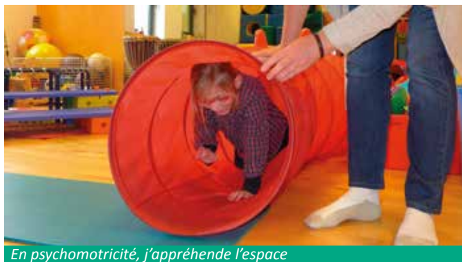
En psychomotricité, j'appréhende l'espace

De même, si vous souhaitez de plus amples informations sur notre ASBL, ou si vous souhaitez la visiter, contactez-moi et je me ferai un grand plaisir de vous recevoir.