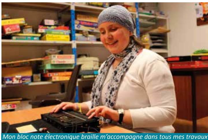
Mon bloc note électronique braille m'accompagne dans tous mes travaux

« La Lumière » entretient une culture d'entreprise fondée sur des principes d'excellence en savoir-être et d'expertise en savoir-faire.