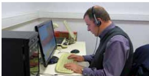
Bart lit internet grâce à une synthèse vocale

Moyenne annuelle : 260 séances de sensibilisation pour 5.450 participants