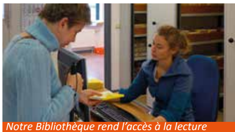
Notre Bibliothèque rend l'accès à la lecture