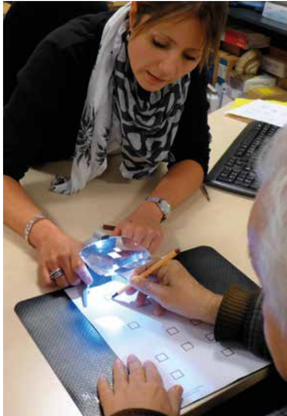
Les aides optiques pour les personnes âgées notamment