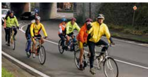
Notre Club Tandem : on a tous besoin d'évasion